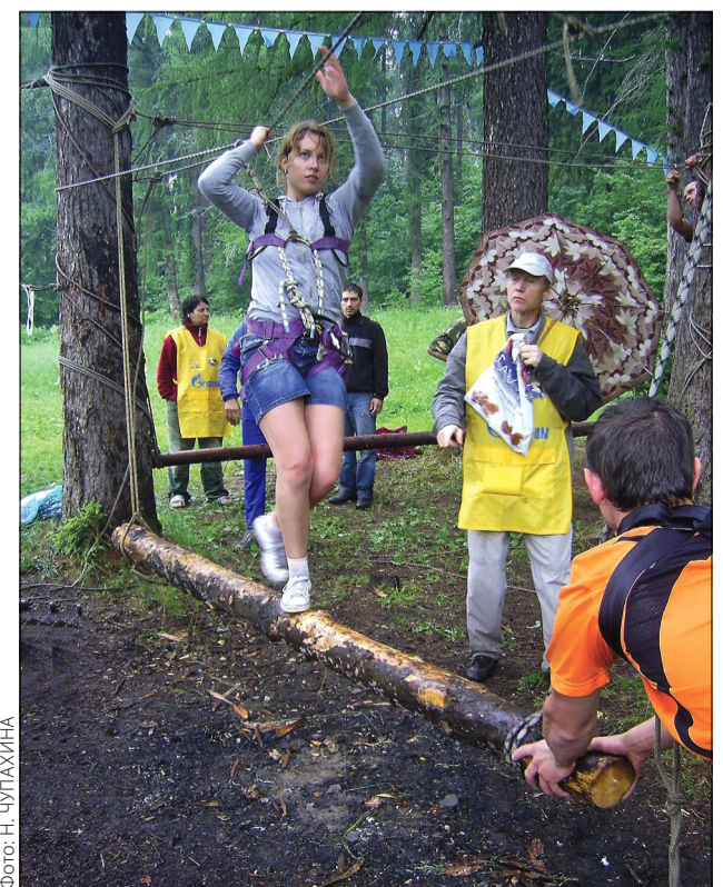
Вот бревно качается, сейчас я упаду!

В следующем году клуб туристов Москвы отметит своё 55-летие! И конечно — не в ресторане, а у лесного костра. Приглашаются все желающие! МГ