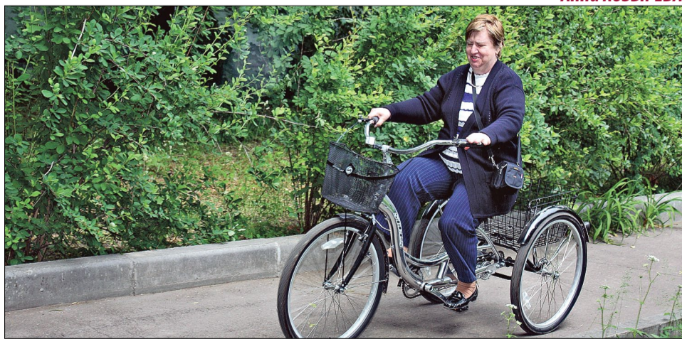
Вот бы на таком велике в магазин!