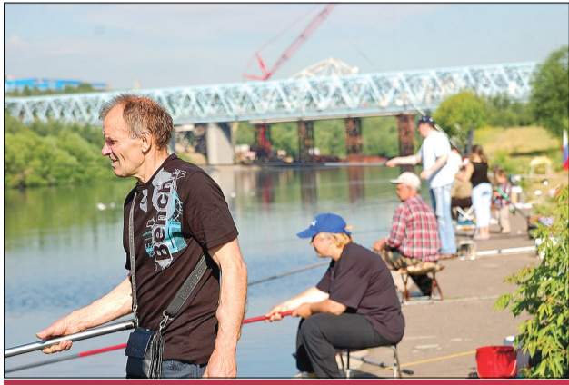
Чемпионат в разгаре

В майском номере газеты сообщалось об открытии Московского клуба глухих рыбаков. А 11 июня при содействии МГО ВОГ в районе Марьино на набережной Москвы-реки в парке имени 850-летия Москвы прошел первый чемпионат глухих столицы по спортивной ловле рыбы.