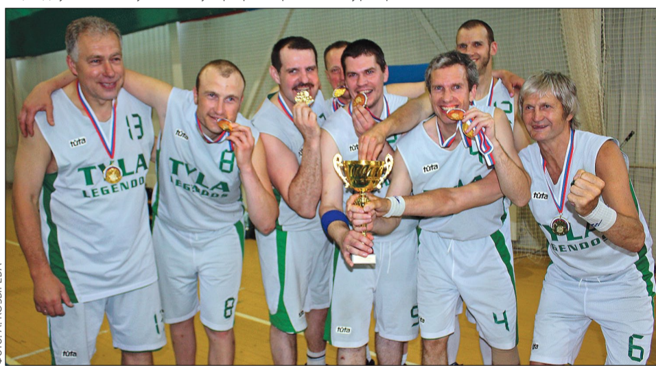
Каунасский «Тила» — чемпион!

Остается еще около 10 секунд. «Тиле» достаточно просто продержат мяч в своем распоряжении до финальной сирены. Даже атаковать особо не надо. Но каунасцы совершают еще одну нелепую ошибку. При розыгрыше