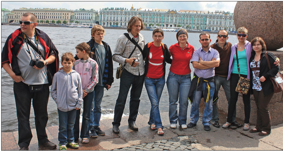
На набережной Невы